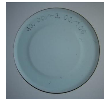
汚れのない レンズ