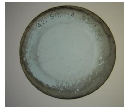
ケア不足により 汚れたレンズ